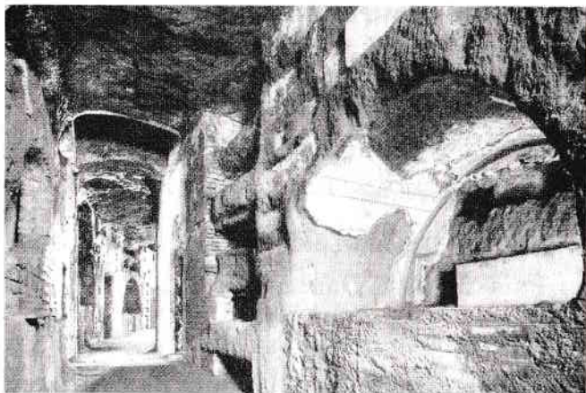
Catacombele Sfântului Calist din Roma

bucuroasă de a-și da viața trecătoare în schimbul celei veșnice.