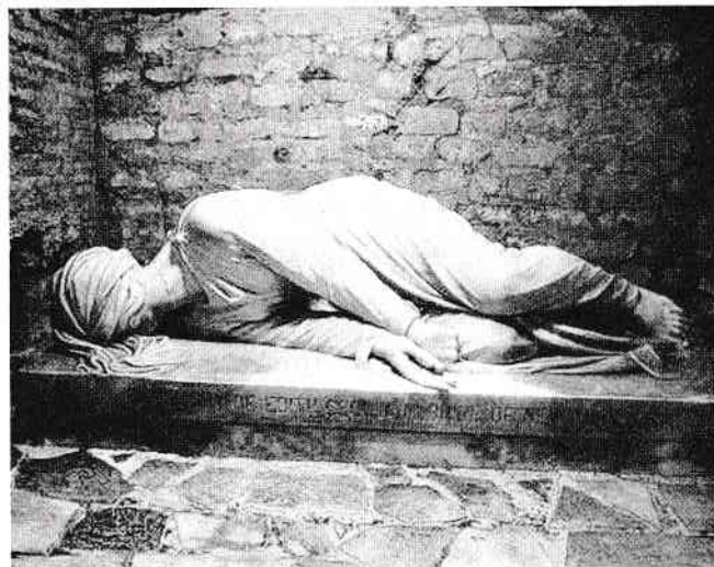
Cripta Sfintei Cecilia din catacombe Sfântului Calist din Roma, locul unde a fost găsită îngropată Sfânta Cecilia

Sfânta Muceniță Cecilia a fost înmormântată, de către creștini, în Catacomba Sfântului Calist - San Callisto, în vreme ce Valerian și Tiburtie au fost înmormântați în Catacomba Pretestato.